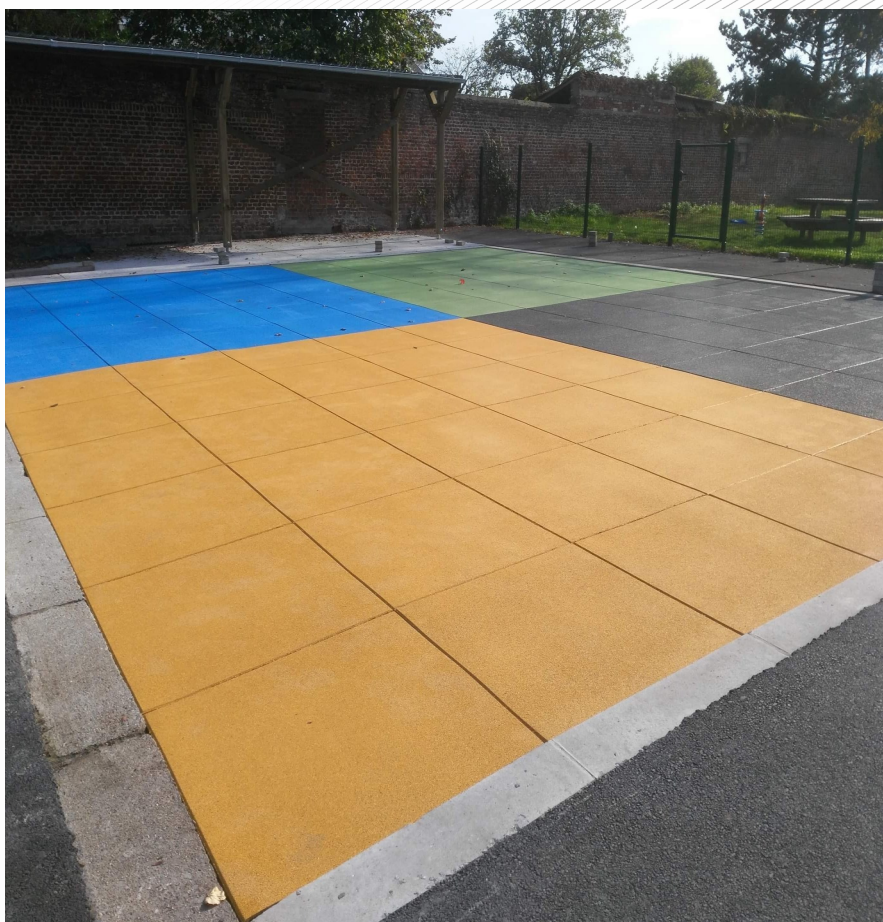
MIX 32 80% gris foncé 20% beige